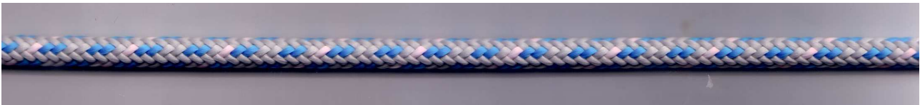
Abb.: Originaldurchmesser SKYSLEEVE 5 mm

Dyneema®-Schleppseil mit Polyester-Umflechtung für den Windenstart von Segelflugzeugen und Motorseglern